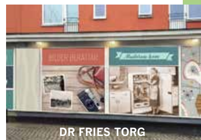
DR FRIES TORG