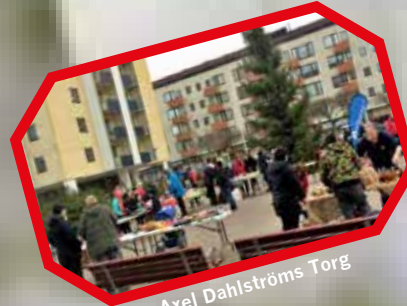
Axel Dahlströms Torg

Barren är precis bortstädade och längtan efter våren är kanske som starkast just nu. Men trots det vill vi dela med oss av några bilder från förra årets mysiga julfiranden på torgen.