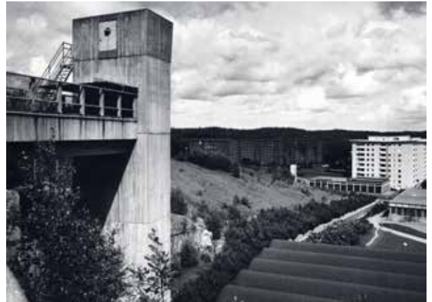
VY ÖVER BERGSJÖN CENTRUM 1981. Under den här tiden monterade delar av Bergsjön ner på grund av det stora antalet outhyrda lägenheter.

Enligt dåtidens ideal omgavs hela området av en ringled och bostadsområdena blev fria från genomfartstrafik. De förbands istället av ett nät av gång- och cykelvägar. Det fanns gott om utrymme att bygga på och de stora grönområdena gav