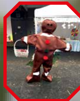
Selma Lagerlöfs Torg