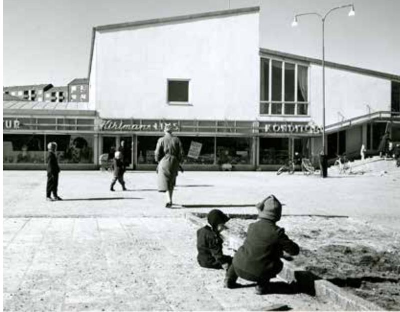
ETT UNGT TORG. Livsmedelsbutik, konditori och Forumhus på Radiotorget vid mitten av 1950-talet.

För att förverkliga visionen inleddes en expropriation av gårdar och marker i Västra Frölunda. Flera familjer fick se gårdar som brukats i sju generationer säljas och utplånas. Staden betalade 2:50 per kvadratmeter för byggbar mark och 50 öre