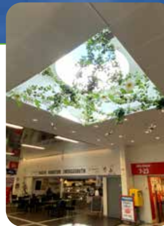
TUVE TORG. Ny sommardekor välkomnar besökare på inomhustorget.