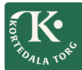
KORTEDALA TORG. Handelsplatsen har fått en uppdaterad logotyp som är en del av en helt ny grafisk profil.