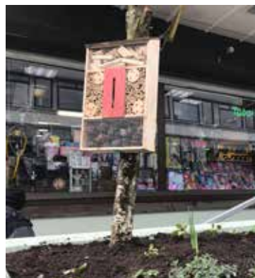
TUVE TORG OCH VÅRVÅDERSTORGET. Hotell för insekter har öppnat för bevingade gäster.