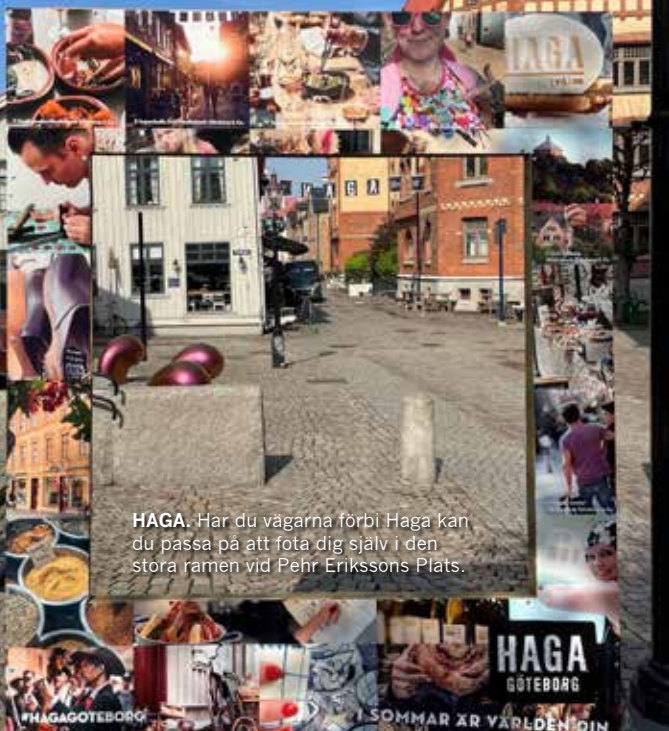
HAGA. Har du vägarna förbi Haga kan du passa på att fota dig själv i den stora ramen vid Pehr Erikssons Plats.