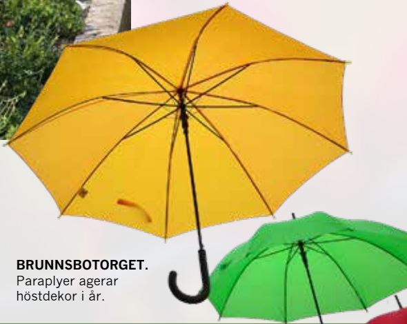
BRUNNSBOTORGET. Paraplyer agerar höstdekor i år.