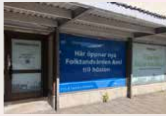
AXEL DAHLSTRÖMS TORG. Nya skyltar berättar att Folkvandvärden öppnar inom kort.