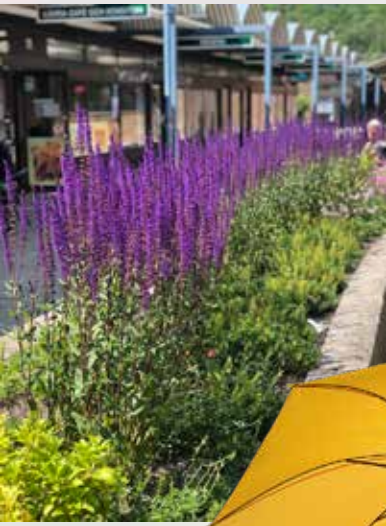
KÄRRA CENTRUM. Nya blomsterbäddar skänker grönska till torget.