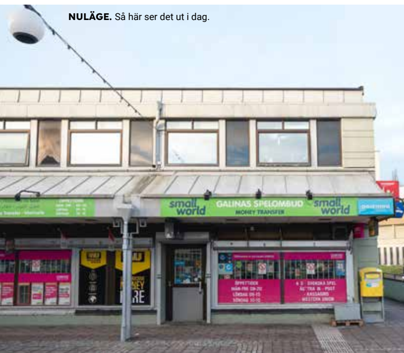
NULÄGE. Så här ser det ut i dag.